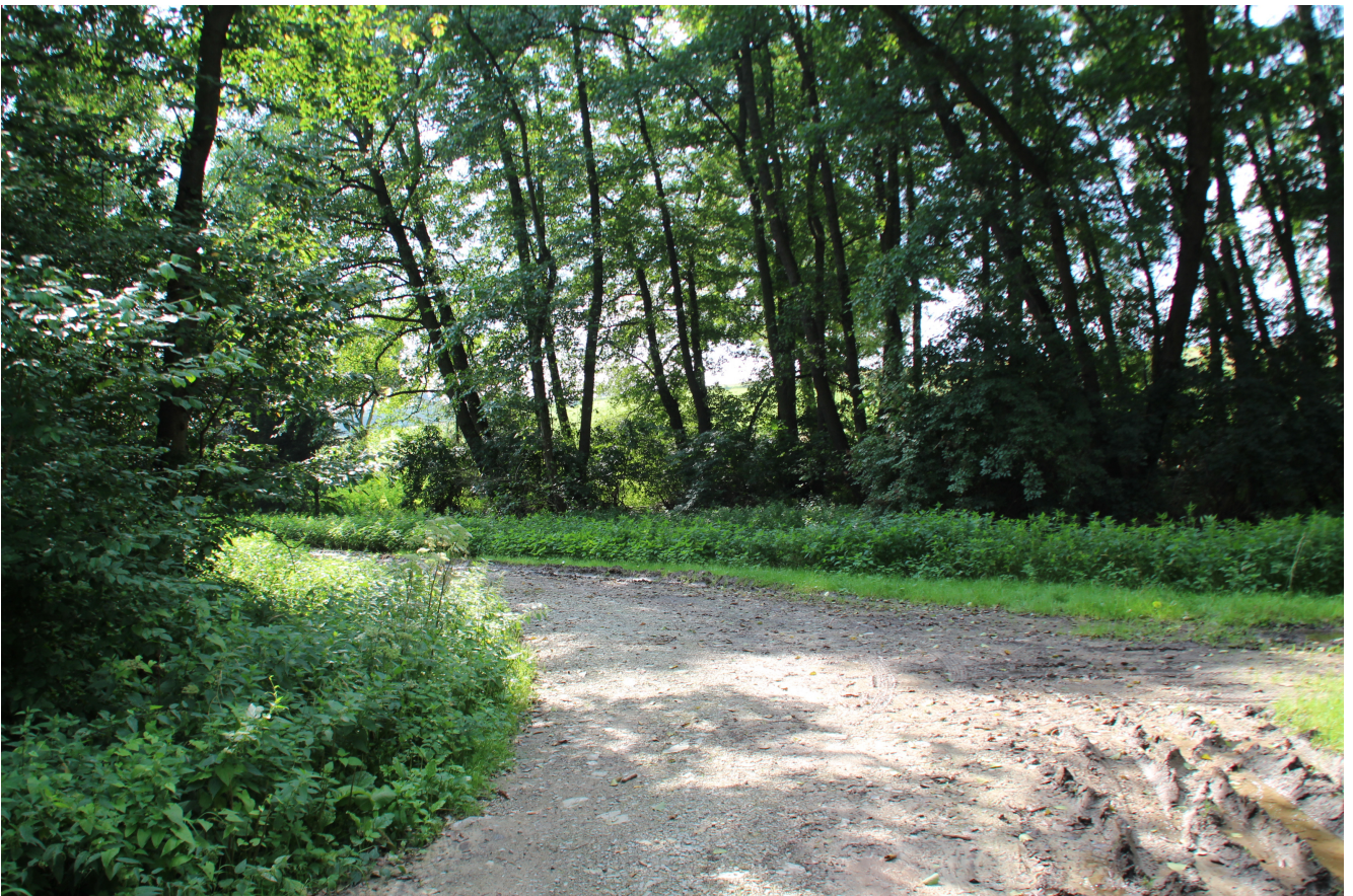
mögliche Stelle für eine Stauanlage – Bild 2 - aus Blickrichtung Norden