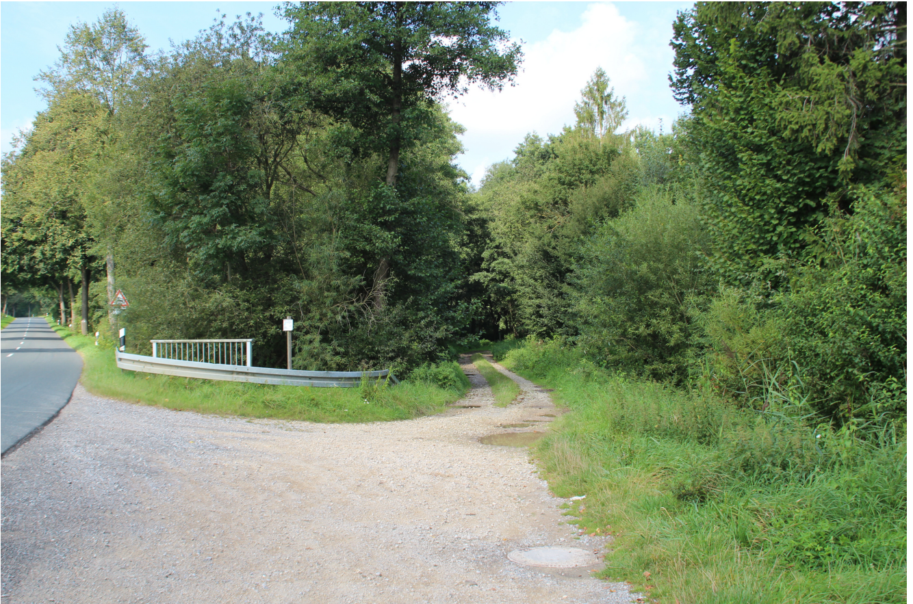
mögliche Stelle für eine Stauanlage – Bild 1 - aus Blickrichtung Osten