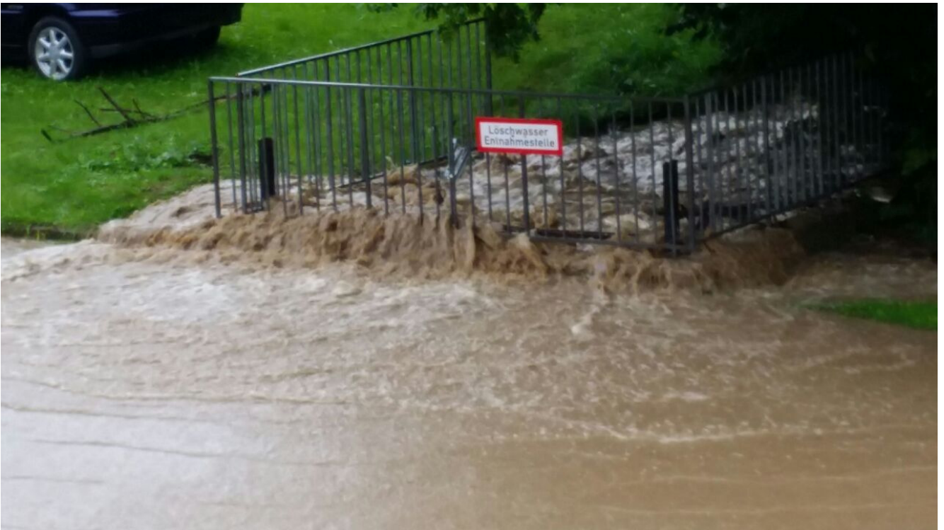
Sottrum Wasserstraße 25.07.2017 - 18 Uhr